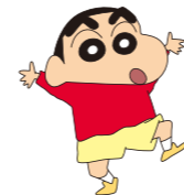
「クレヨンしんちゃん」 ©白井権人/双葉社・ソニー・テレビ朝日・ADK

春日部市に特別住民登録されている「クレヨンしんちゃん」は子育て応援キャラクター、まちの案内人として活躍中です。しんちゃんのほかにも、まちなかには動物キャラクターがたくさんいます。ファミリーで、楽しく探してみてください。