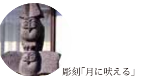
彫刻「月に吠える」のフクロウ 9ページ参照

距離と所要時間：(約2.9km/約43分) 消費カロリーの目安：男性136kcal 女性112kcal