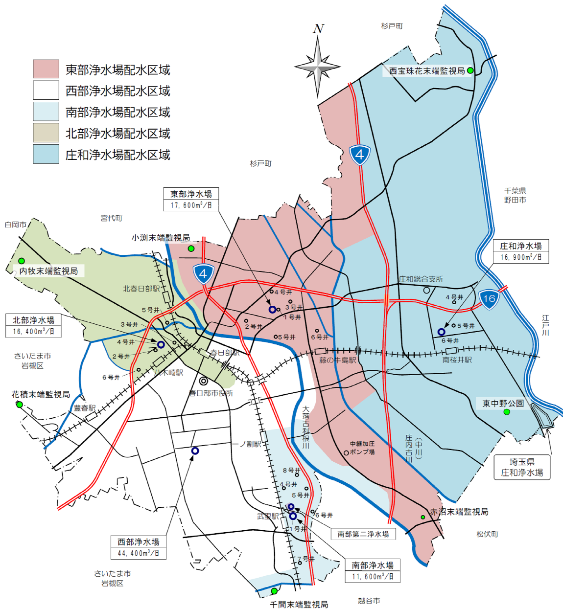
図表2 給水区域および各施設位置図