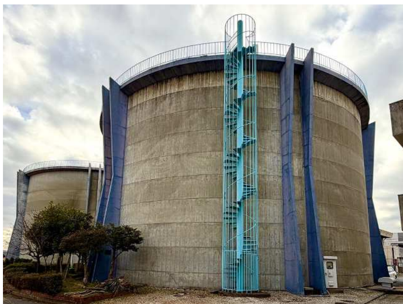
西部浄水場配水池

水質検査は、水質基準に適合し安全な水であることを保障するために不可欠であり、水道水の水質管理の中核をなすものです。検査の適正化を確保するため、毎年、水道法に基づく項目、頻度をはじめ、実施内容を水質検査計画として定めています。