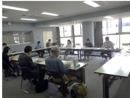
9-3 文化財保存活用地域計画協議会