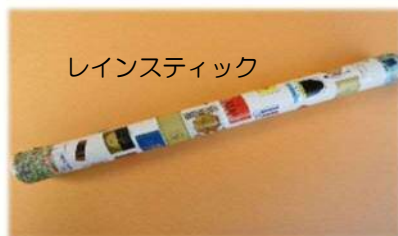
レインスティック