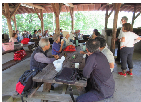
林業体験 大滝げんきプラザ