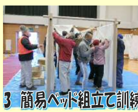
3 簡易ベッド組立て訓練