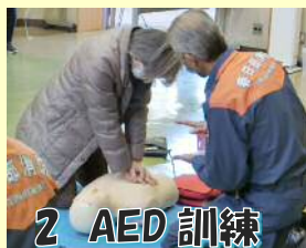
2 AED 訓練