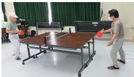
↑ 会議テーブルで簡易卓球

毎月簡単な工作やゲームを しています。 参加者同士和やかに話ながら、 和気あいあいと楽しんでいます。