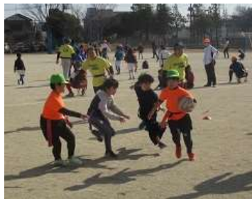
タグラグビー教室

2月18日（日）藤塚小学校において、三世代交流スポーツフェスティバルが開催されました。当日は天候にも恵まれ、校庭ではメインスポーツの「タグラグビー教室」のほか、スポーツギネス大会・体力測定が行われました。また、コーナースポーツとして、体育館と校庭で卓球・太極拳・剣道・サッカー・ソフトボール・ラダーゲッターが行われ、様々な世代の参加者が交わり、思い思いに体を動かすことができました。役員の皆様、ボランティアでご参加くださった皆様、藤塚小学校の先生方、ご協力ありがとうございました。