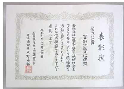
シラコバト賞の表彰状

この度、豊野地区文化連盟が、彩の国コミュニティ協議会「第57回 シラコバト賞」を受賞しました。昭和49年(1974)の第1回文化祭以来、半世紀にわたり地域の文化振興に貢献されてきたことが評価されたもので、「心のふれあいを深める活動」に対し団体として表彰されたものです。文化連盟主催としては最後となった今年の文化祭も、去る11月9日(日)豊野市民センターで開催され、会員の皆さんが日頃の学習成果を発表し、地域住民のふれあいの場として、大勢の方にお越しいただくことができました。文化連盟会員の皆さん、お疲れ様でした。当日ご来館いただきました皆さま、誠にありがとうございました。