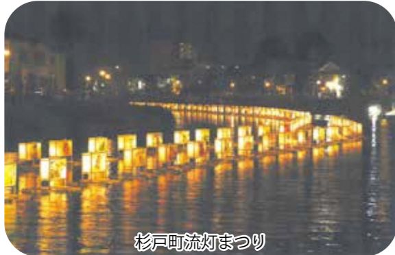
杉戸町流灯まつり

杉戸支部は十名の保護司によって構成されています。年に三回ほどの自主研修会を行ない、情報交換をする場を設けています。コロナウィルス流行以前は「社会を明るくする運動」を「杉戸町産業祭」において啓発品を配布する活動を行なってきましたが、現在は自粛しています。