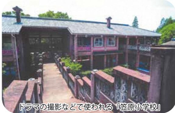
ドラマの撮影などで使われる「笠原小学校」

宮代支部は八名の保護司で活動をしています。コロナ禍以前は春日部地区保護司会の定例研修・刑務所等の視察研修・行政との会議を実施しておりました。本来でしたら、七月の『社会を明るくする運動』では、運動を広めるために町内三校の中学校に赴き、啓発品の配布・俳句の募集を実施していますが、現在は