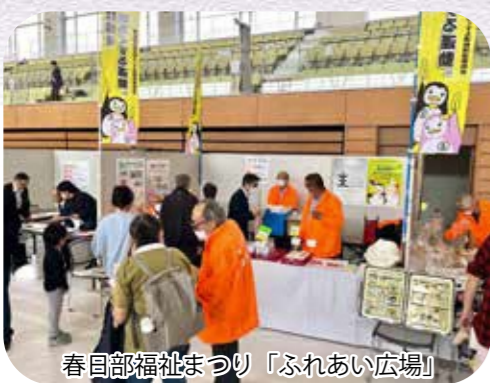
春日部福祉まつり「ふれあい広場」

春日部支部保護司会としてブースを出し、更生保護とは？保護司とは？を知っていただく為の啓発活動を行いました。