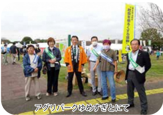
アグリパークゆめすぎとにて

七月の「社会を明るくする運動」では、町内の中学校に赴き学校長と懇談し、生徒に啓発品の配布をおこないました。十一月五日（日）にはアグリパークゆめすぎとで開催された「農業祭」に参加して、来場者に啓発品の配布もおこないました。