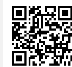
日本地域情報コンテンツ大賞 「春日部マガジン」ページの2次元コード