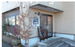
小さなせんべい専門店